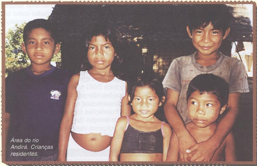
Área do rio Andirá. Crianças residentes.